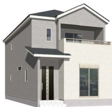
2号棟完成イメージ (現況と異なる場合がございます)